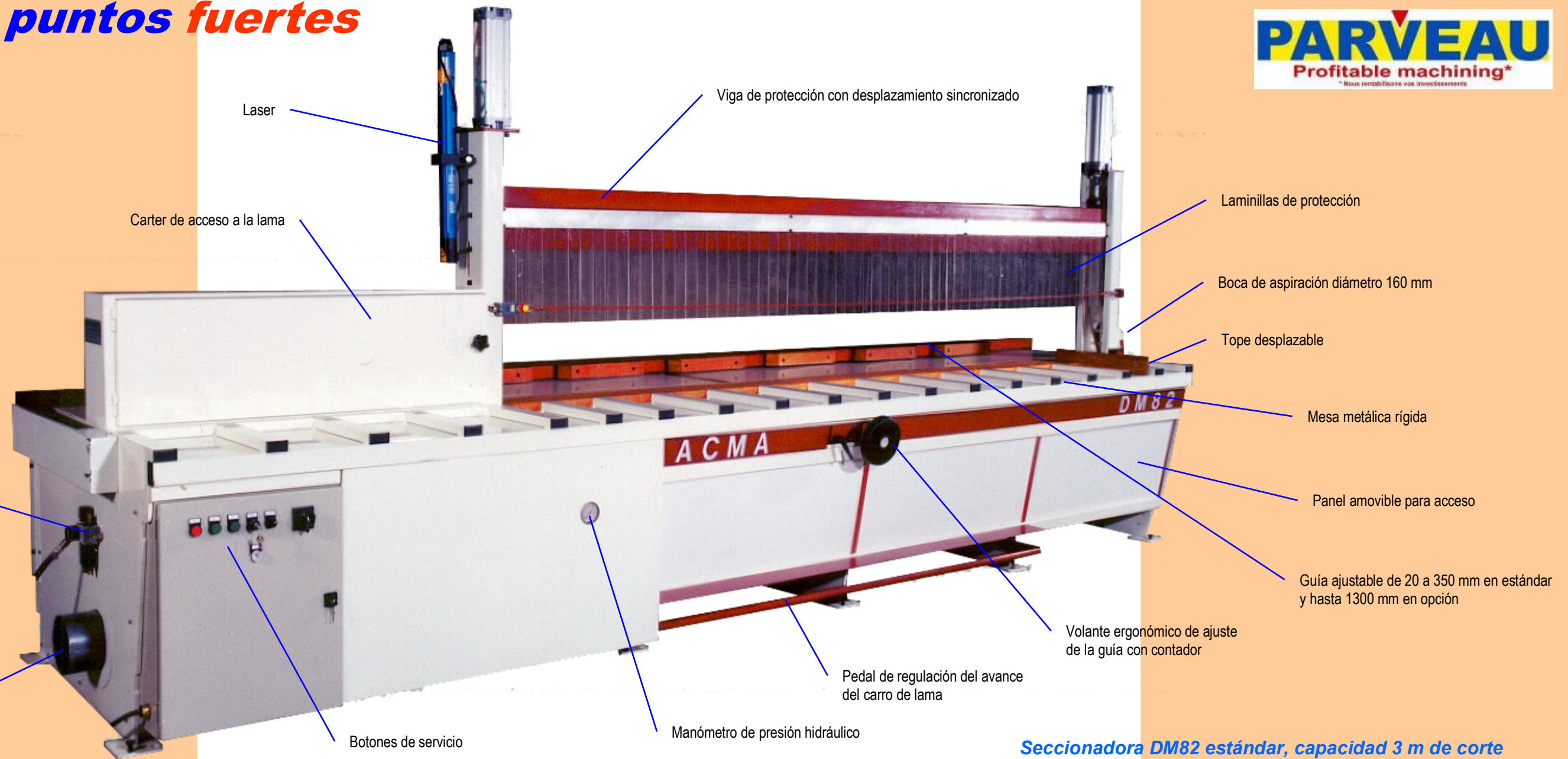
Seccionadora DM82 estándar, capacidad 3 m de corte