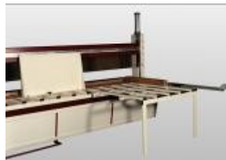
Mesa para corte de escuadra