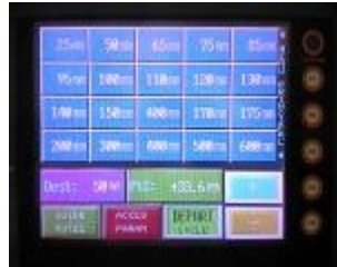
Mando DIGIT con pantalla táctil