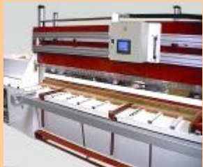
Maquina equipada de un mando DIGIT. El armario puede desplazarse a lo largo de la máquina.