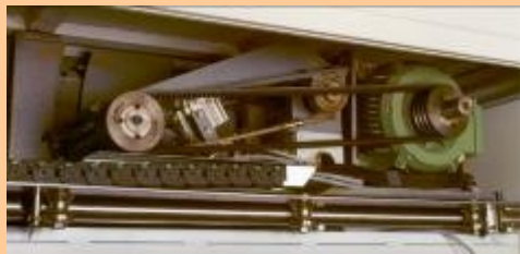
Vista de detalle del carro. La motorización puede variar de 7,5 hasta 15 kW según opción. La altura de corte es seleccionable al armario de mando.