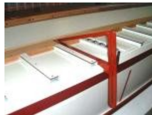
Compas para cortes inclinados