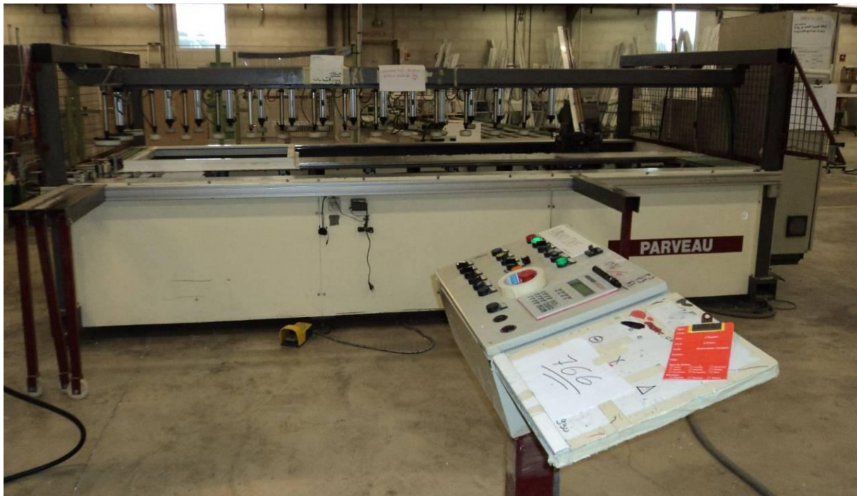
Vue d'ensemble avec le pupitre de commande