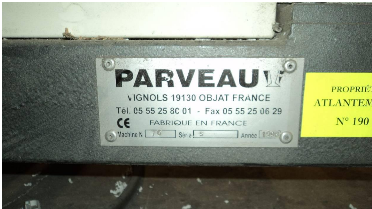
Vue de détail de la plaque constructeur