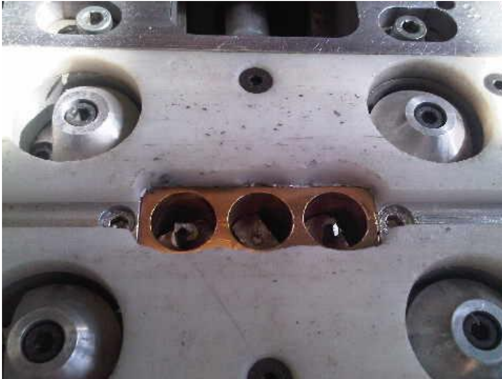
Vue de détail du boîtier multibroches, 3 trous entraxes 24 mm, permettant de percer les platines en une seule opération