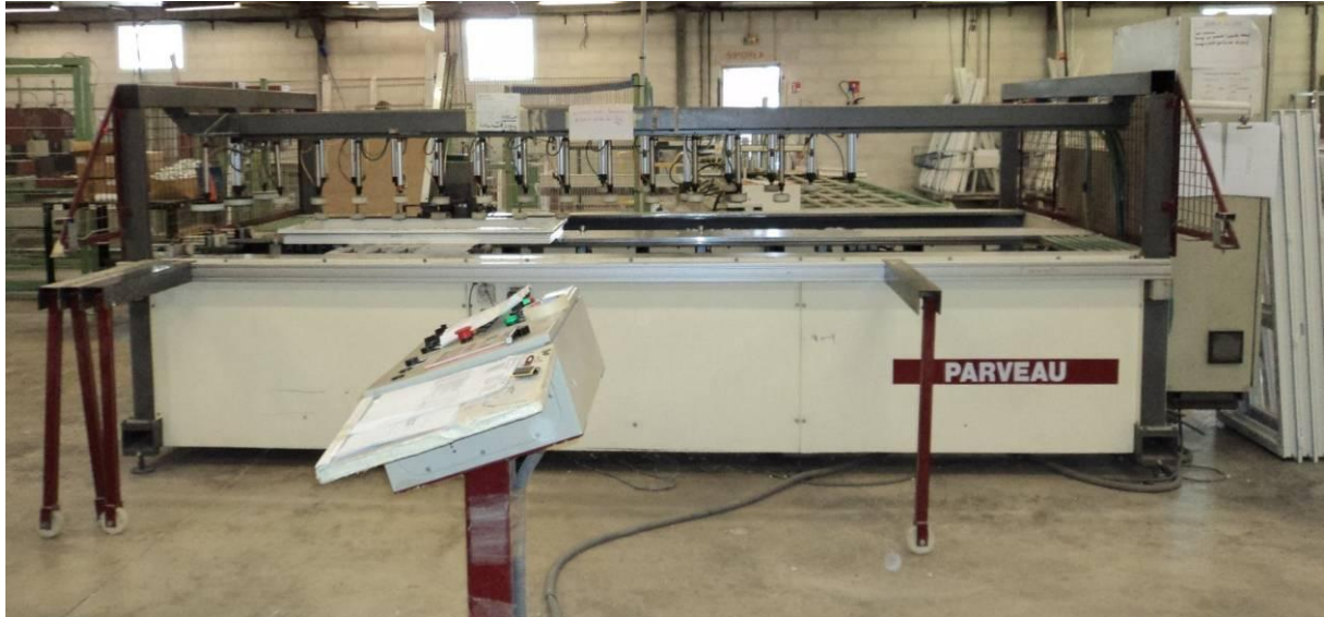
Vue d'ensemble avec le pupitre de commande