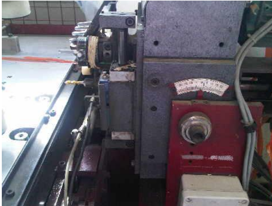
Vue de détail de l'unité de perçage fichage